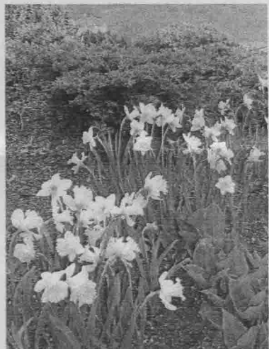
Rudenī iestādītās narcises